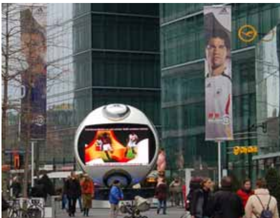
Blick auf den „Eyeball“ vom Kurfürstendamm