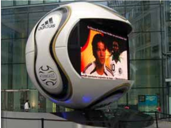
Weltpremiere: der „Eyeball“ im Berliner Neuen Kranzler Eck

Materialien und Vorgaben. „So verlangt jedes Projekt eine maßgeschneiderte Lösung und ist somit ein Werbeunikat.