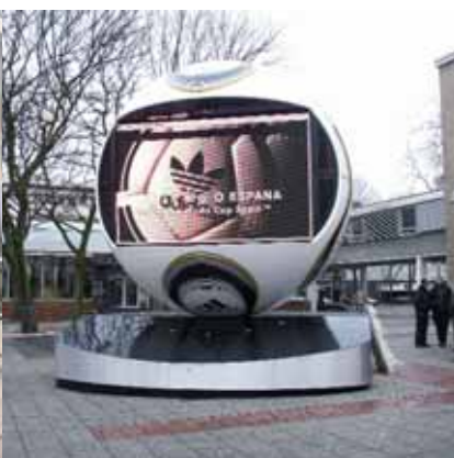
Der zweite „Eyeball“ auf dem Kölner Opernvorplatz