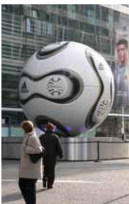
Rückansicht „Eyeball“: ein perfekter Nachbau des Original