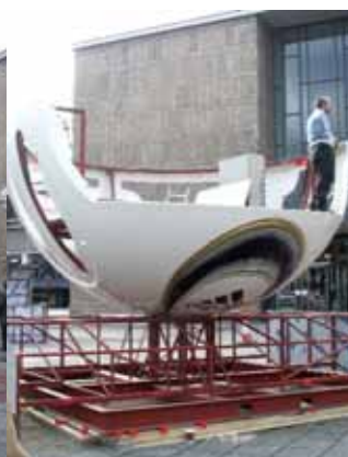
Montage des „Eyeball“ auf dem Kölner Opernvorplatz