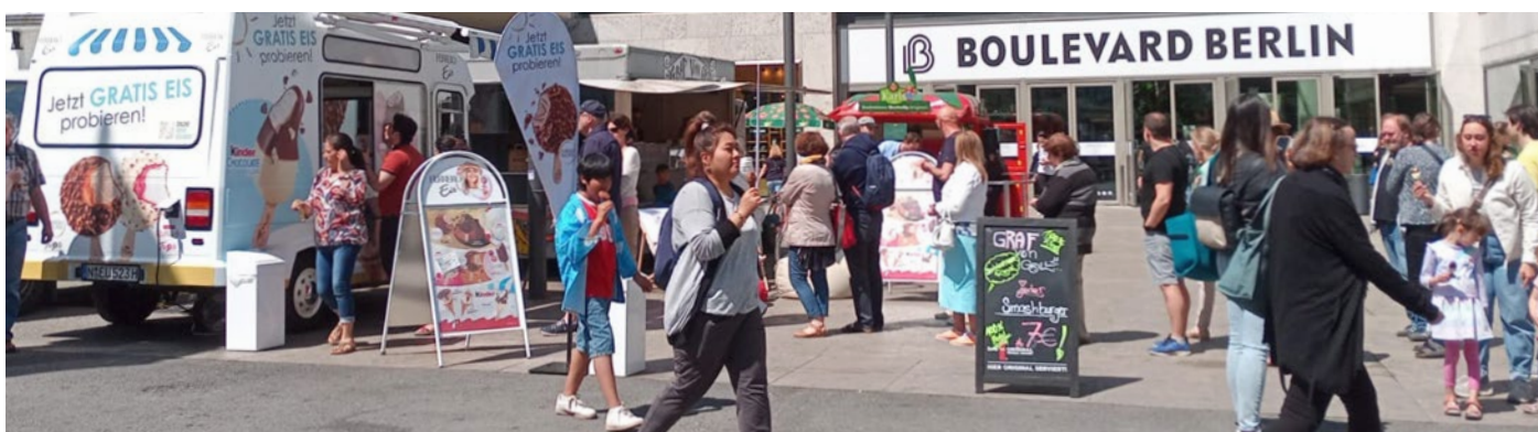
Sommerliches Setting bei der RoadShow

Für jeden etwas dabei: Die Ferrero Eis Sampling City Tour 2023 quer durch Deutschland löst überall gute Stimmung und lange Schlangen aus.