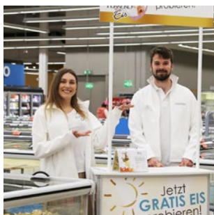
POS Sampling in 90 Märkten