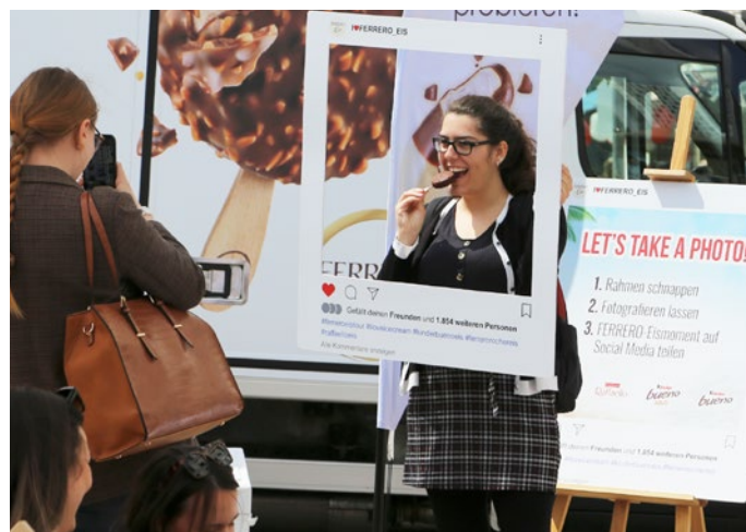
Viel Spaß bei der Foto-Opportunity...