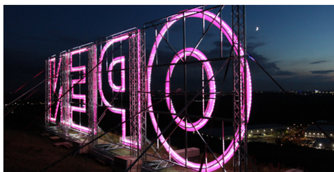
An der Halde Hoheward stand Ende August 2020 die Installation „OPEN“

Im September wurde die neonfarbene Leuchtschrift um ein „H2“ ergänzt: „H2OPEN“ steht für das Zukunftspotenzial der Wasserstoff-Technologien im Ruhrgebiet. Herten steht ganz besonders für den Strukturwandel im Ruhrgebiet: Die Stadt war früher die größte Bergbaustadt Europas und erfindet sich gerade als Wasserstoffstadt neu. Am Fuß der Halde Hoheward, die noch aus Kohlezeiten stammt, befindet sich heute das Wasserstoff-Anwenderzentrum.