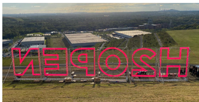
Weithin sichtbar: Wasserstoff ist die neue Kohle