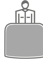
Theke: b 84 cm x h 93 cm