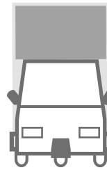
1 Frontfläche: b 107,5 cm x h 70 cm