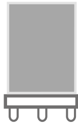
1 Heckfläche: b 107,5 cm x h 143,5 cm