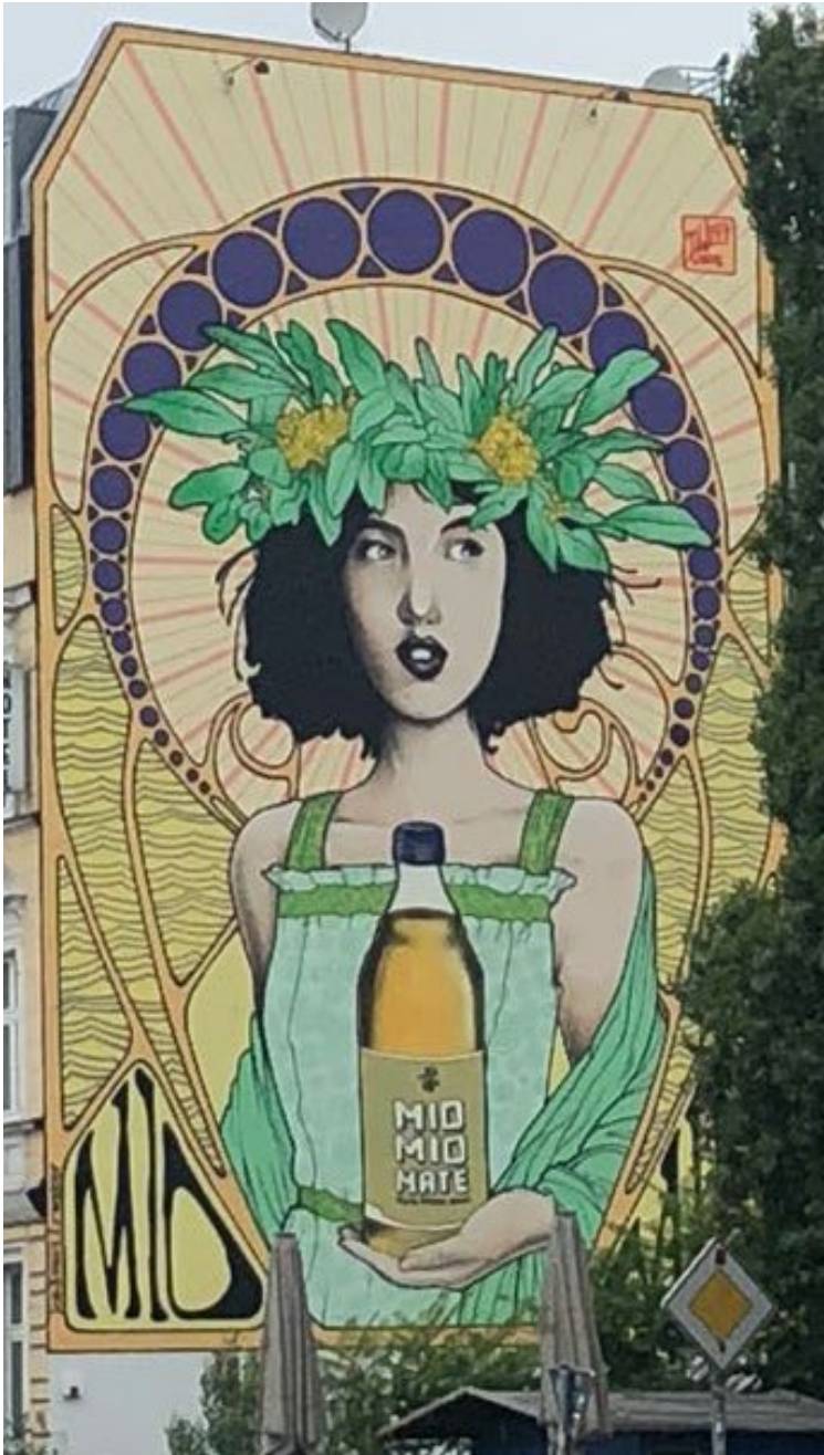
Künstlerisch wertvoll: Die Limonade für Erwachsene im Jugendstil in Berlin

Mit der Kampagne Mio Mio #dulebst rief die Berentzen-Tochter vivaris zu urbaner Lebensfreude auf und machte die Marke so zum Botschafter einer positiven Haltung: Lebe das Leben und genieße den Moment. Darüber hinaus verfolgte die Kampagne mit der Ausschreibung für die Gestaltung eines Plakatmotivs einen künstlerischen Anspruch. Gewinnerin war die „jugendstilische Reklame-Dame“ von Johannes Weber. Sie konnte das Team der Kreativagentur Pahnke Marken-