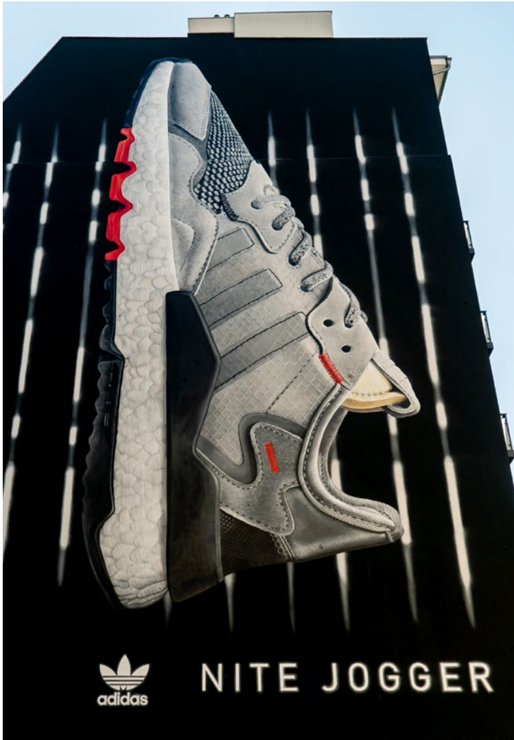
Er überragt alle: Der haushohe NITE JOGGER