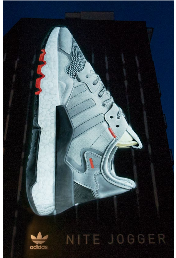
Nachts beginnt der beliebte Sneaker zu leuchten

Adidas Originals verpasste vor kurzem seinem legendären Roadrunning-Sneaker NITE JOGGER ein weiteres ästhetisches Update und entwickelte für ihn eine neue Kampagne, die von einem globalen Netzwerk von Künstlern inszeniert wurde. Es entstand eine Hymne an Menschen und Dinge, die in der Dunkelheit zu strahlen beginnen. Illuminiert und strahlend war jetzt das Kampagnenmotiv für 28 Tage in Berlin gleich zweimal zu sehen: In der Oranien- und der Greifswalderstraße faszinierten die jeweils über 100 m 2 großen WallPaintings nicht nur durch die gebeamteten Lichtanimationen, sondern auch durch die Detailgenauigkeit der Graffiti-Künstler.