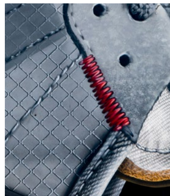
Jedes Detail wird berücksichtigt