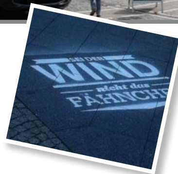
Die KreideStencils machten vorab auf die Aktion aufmerksam.