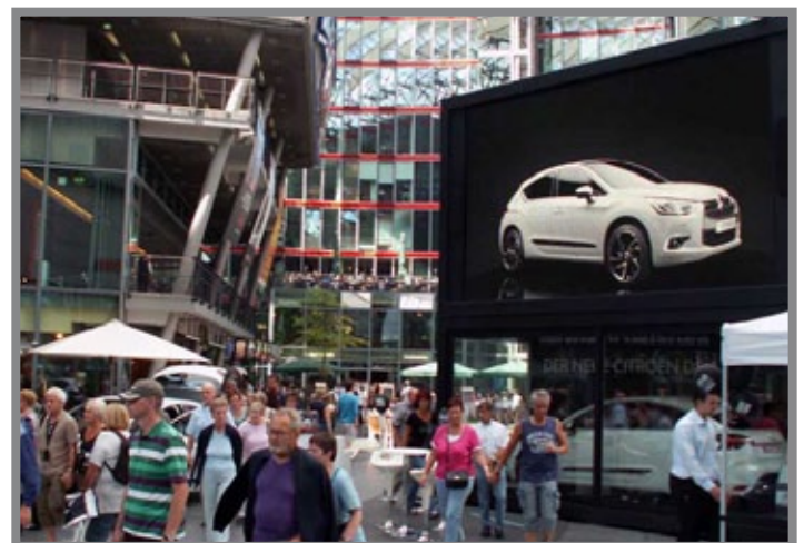
Der Blickfang der Roadshow war der LED-Showroom.