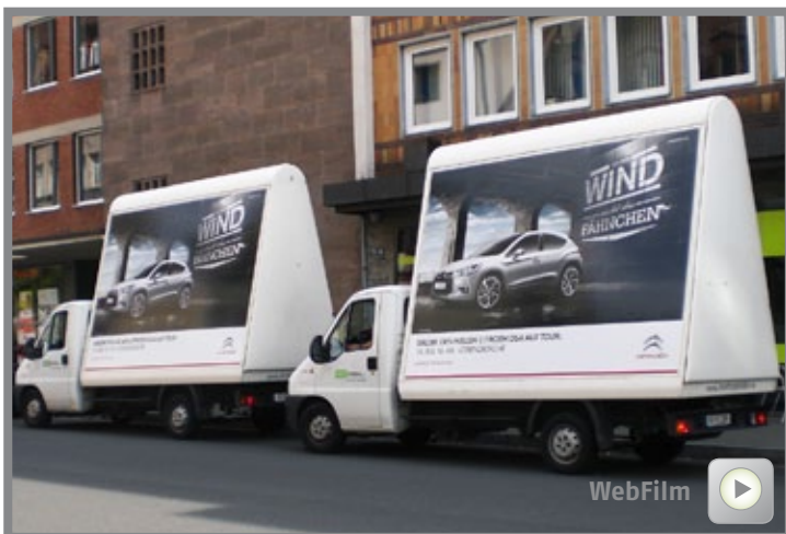
MotorPoster werben großräumig.