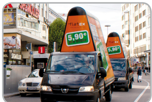
Beispiele: MotorPoster Jet